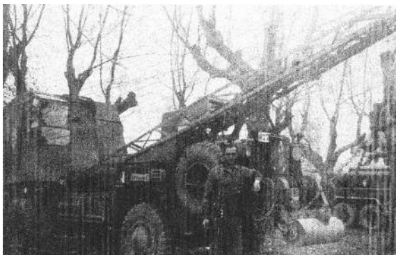
Les sapeurs du 96 ème Génie, qui œuvrent sans cesse pour rétablir les communications ou miner les terrains

Tout à l'ouest, sur les crêtes, les spahis et les goumiers s'emparent peu à peu du Surcenord, de Gazon l'Hôte, du col du Calvaire. Mais les Allemands tiennent toujours l'hôtel du Lac Blanc. À l'est, les tirailleurs algériens progressent vers le Busset.