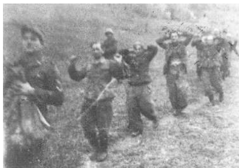
Prisonniers allemands aux Chaisgayas