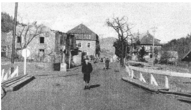
Le pont provisoire sur la Weiss en 1945, au bas d'Orbey.

Mais le souvenir de la Libération, le retour de la liberté, de la France, soutient les cœurs. Et la reconnaissance pour les Libérateurs reste toujours vive.